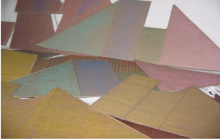
Figura 1 - Título da figura 1.

texto texto Texto texto texto Texto texto texto Texto texto texto Textotexto texto